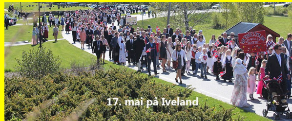
17. mai på Iveland