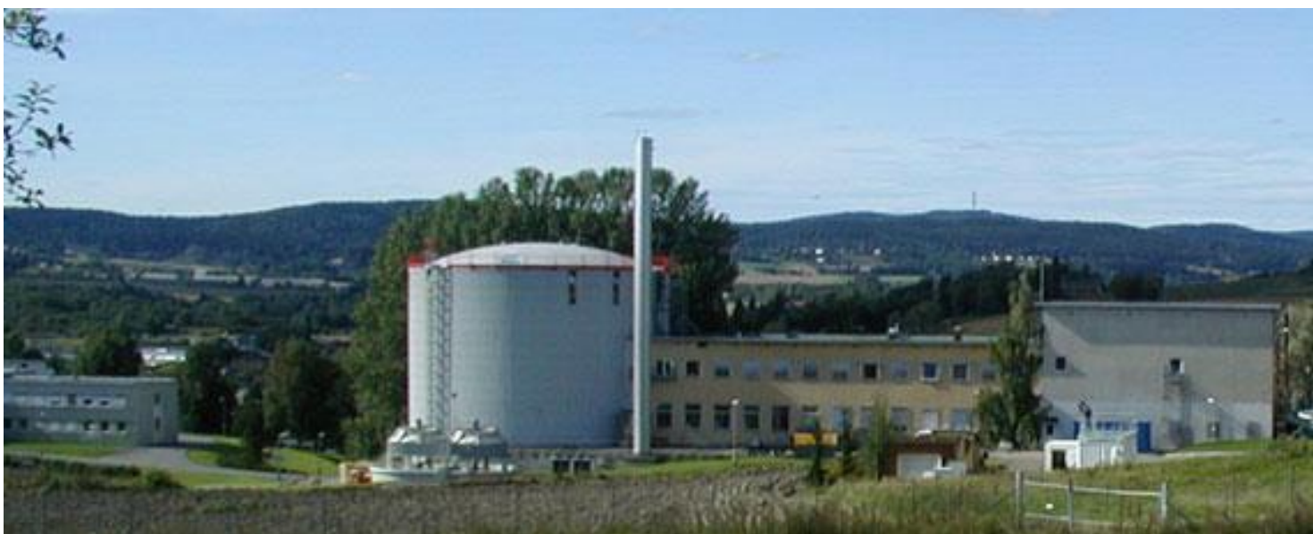
Foto: Direktoratet for strålevern og atomsikkerhet, Kjellerreaktoren