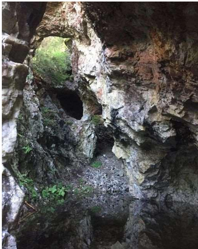
Frå Aretveitsgruva, foto Geir Nateland.

Barnehagane i kommunen har ei kasse med mineraler som har vore i bruk, og vil sørge for å få gruvedrift inn i årsplanane.