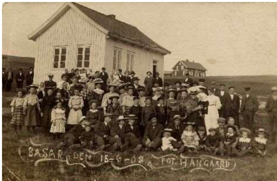
18. august 1908 var det basar på Eieland skule. Fotograf Hangaard var der.

Skolane i Iveland har ein plan for besøk til Eieland skule og bygdemuseet på Fjermedal. Denne skal tas opp på nytt og ein vil sørge for at den blir følgd.