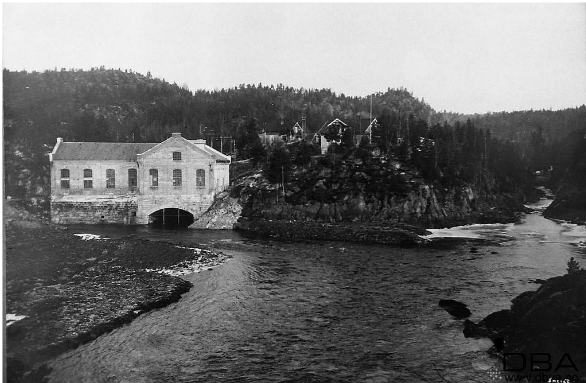
Kringsjø kraftstasjon 1914.

Spor etter Kringsjø kraftstasjon er tatt vare på og tilrettelagt i offentlig regi. Desse spora er elles i stor mon registrert og kartfesta gjennom eit prosjekt initiert av Aust-Agder fylkeskommune, og utført av lokale krefter. Lista er langt frå komplett. Tilrettelegging og vedlikehald i samarbeid med grunneigar kan vera aktuelt.