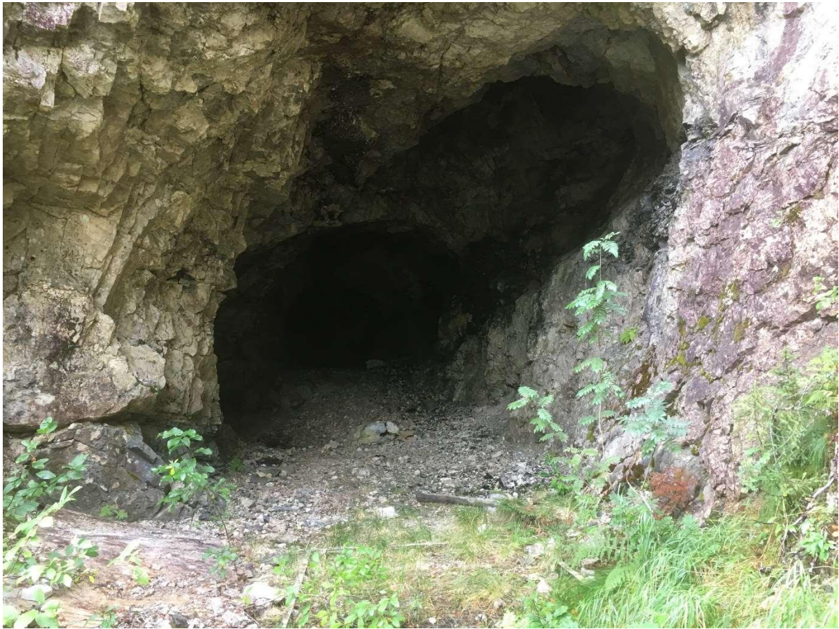
Horja gruve, Mølland