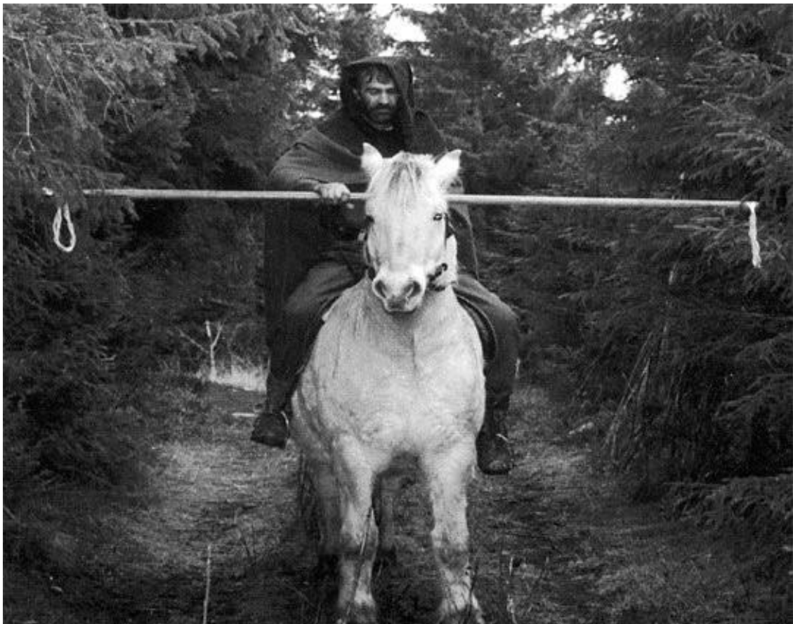
Ridevegen skulle vera så brei at spydet ikkje tok bort i greiner på sidene.