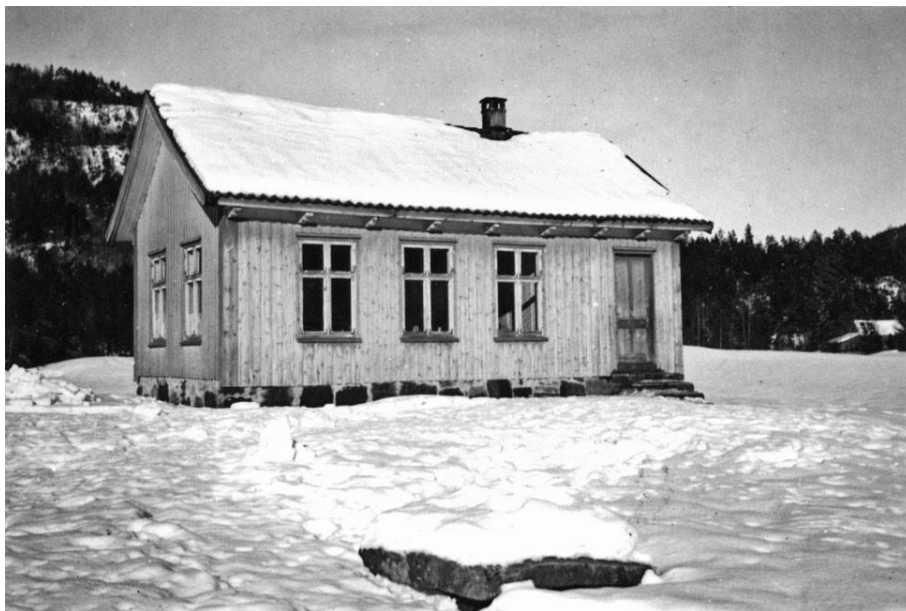
Skulehuset på Frøyså. Ukjent fotograf.