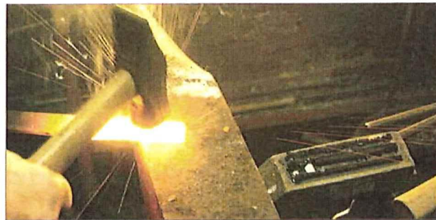
Her vert ein framtidig jaktkniv til eit jaktlag aust i Iveland tilverka.