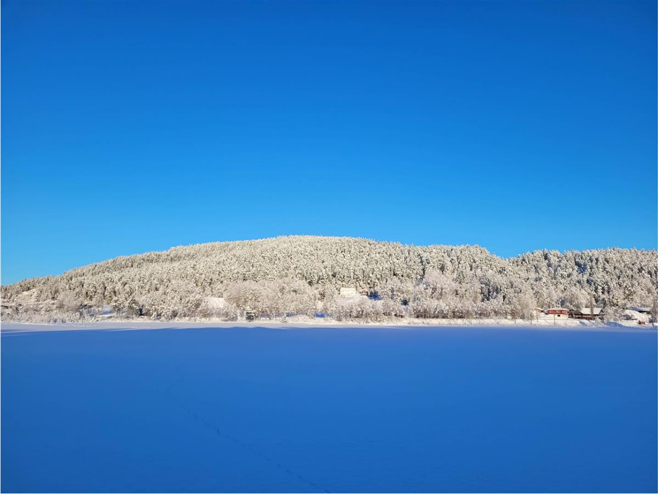
Vinterstemning i Iveland