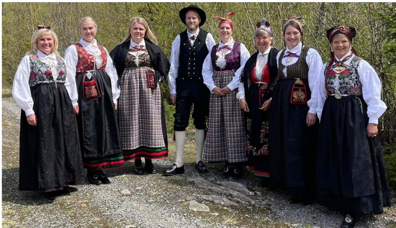
Ivelandsbunaden - et vakkert skue!

Vår visjon er at Iveland skal være et godt sted å leve sammen