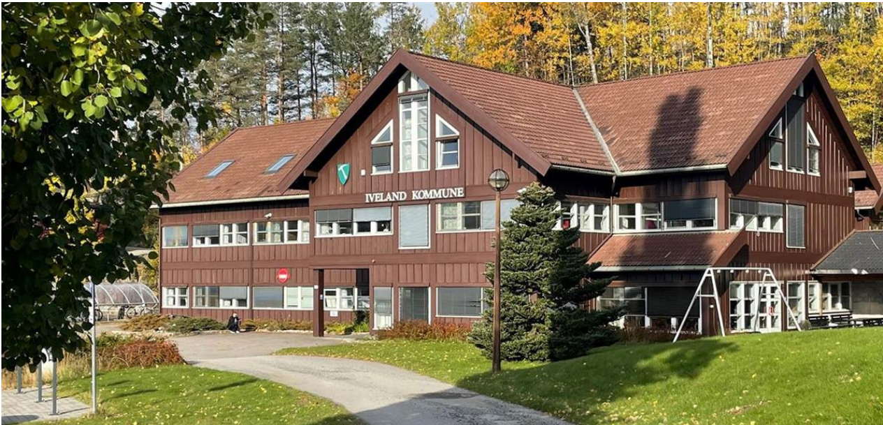
Norges fineste kommunehus