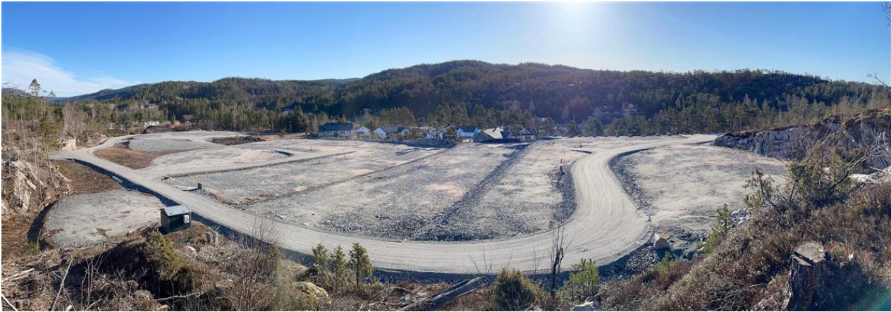
Bjørnehatten på Skaia