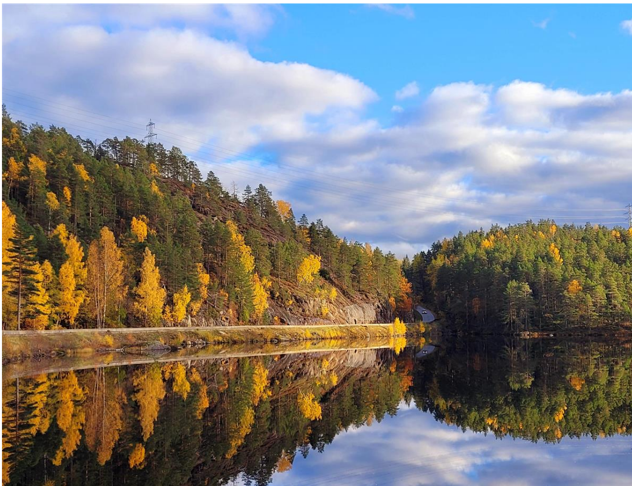
Høststemning i Iveland